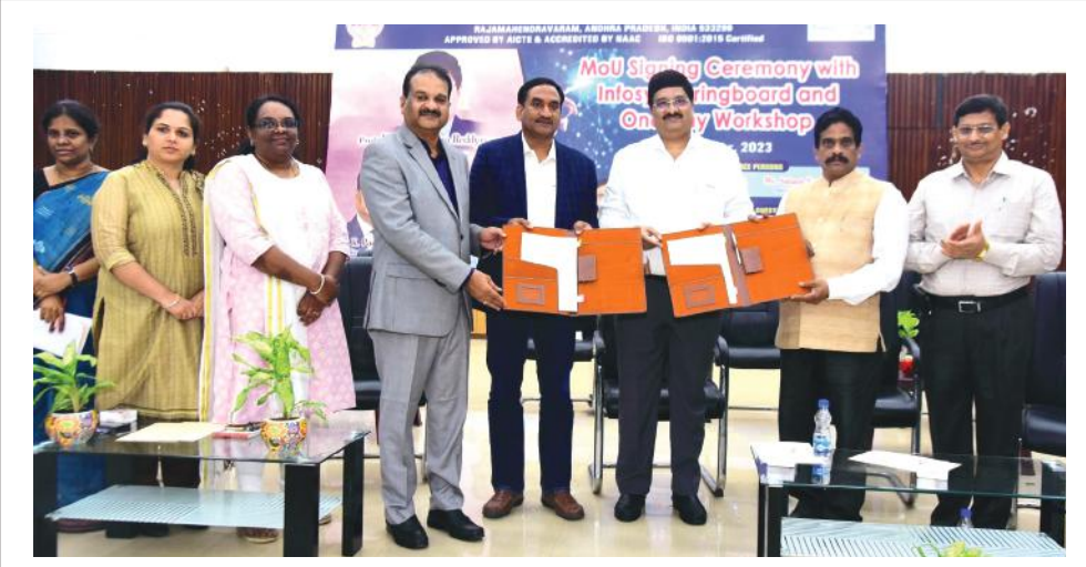
ఇన్స్పిసిస్ స్ప్రింగ్ బోర్డ్ తో ఎంవోయు కుదుర్చుకుంటున్న దృశ్యం